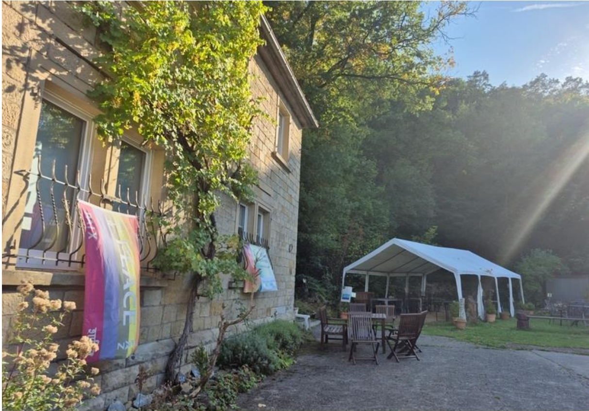
Museumshof (Eingang) Nahe der Natur Staudernheim.

Bild vom Saisonende 2025 – am 19. April geht es wieder los.